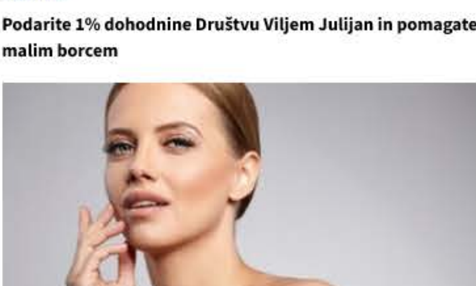
Ta trik nampe kožo in nudi botoks učinek!