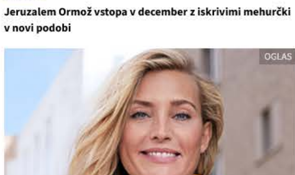
Beiersdorf Oskrite svojo 24-urno lepотно rutino proti gubam!