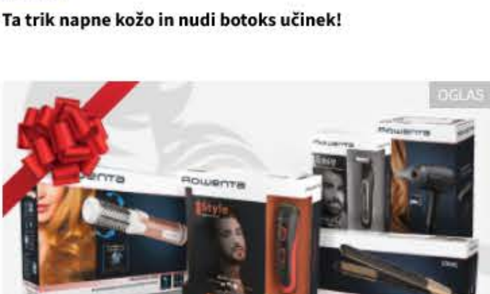
Prižarjate nasme z darilom Rowenta zanjo in zanj