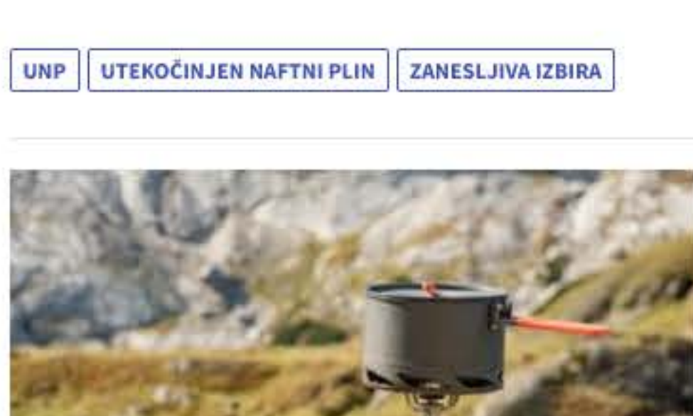
Dostopna energija - pomembna prednost današnjega časa