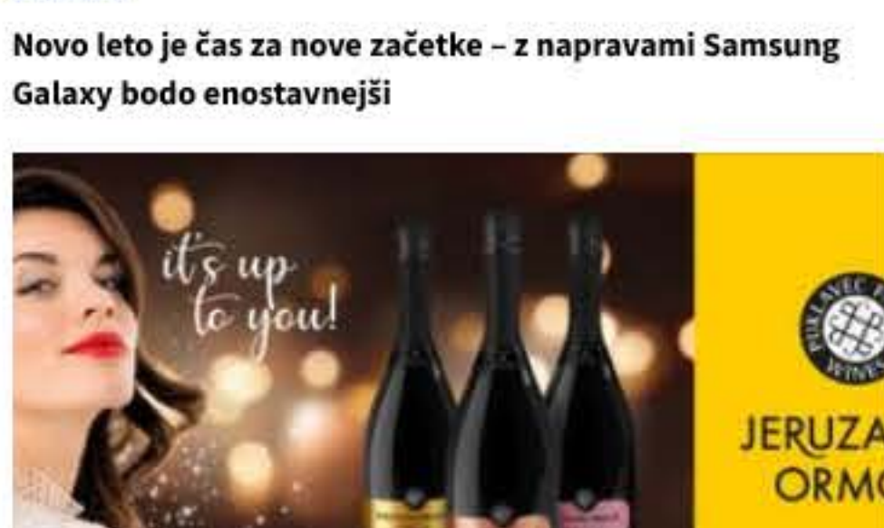
Jeruzalem Ormož vstopa v december z iskriimi mehurčki v novi podobi