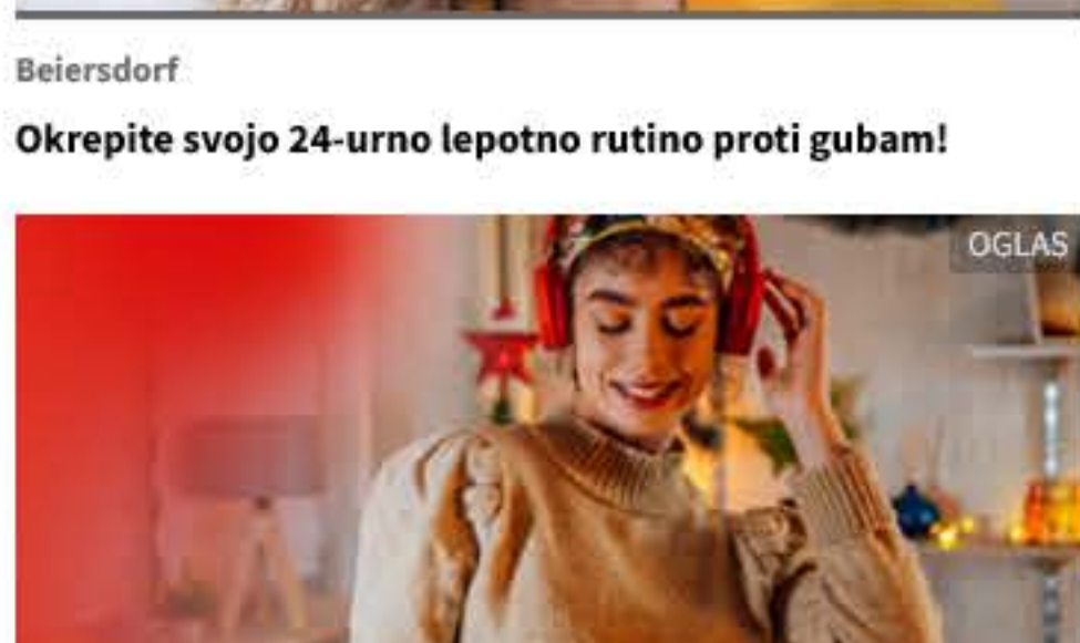
Ho, ho, ho, glej ti to! Pridni in poredni dobite VOVO brezplačno za pol leta na A1 Vajb.