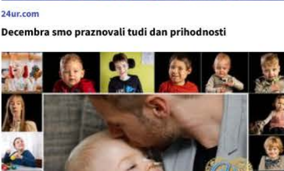
Podarite 1% dohodnine Društvu Viljem Julijan in pomagajte malim borcem