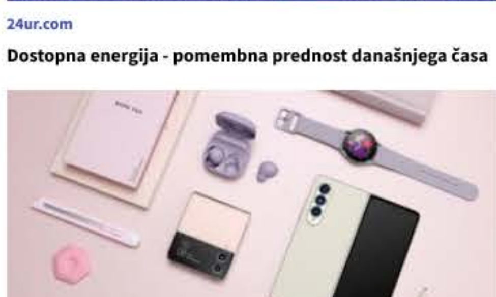
Novo leto je čas za nove začetke - z napravami Samsung Galaxy bodo enostavnejši